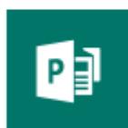
Publisher (solo PC)