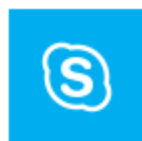
Skype for Business